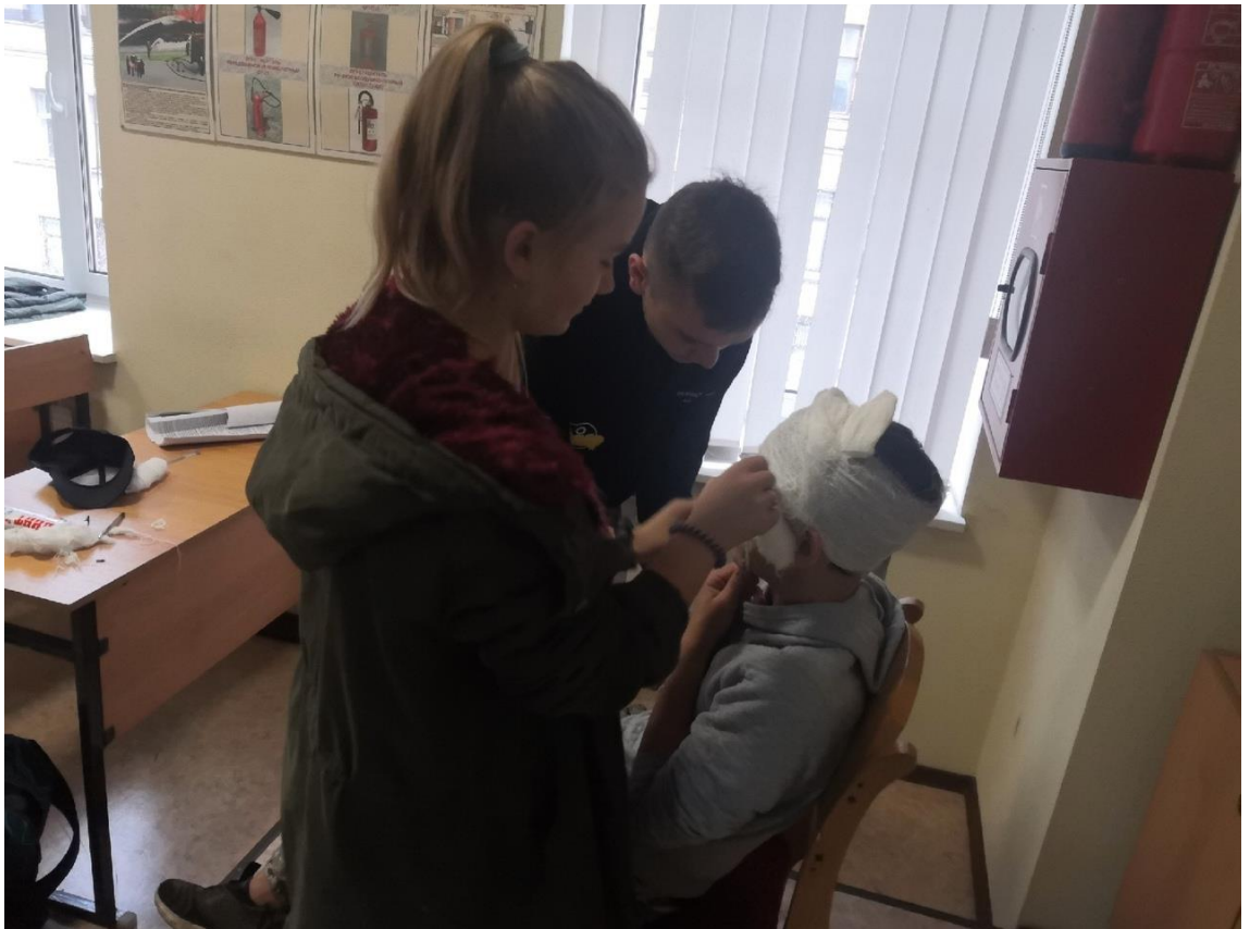
ОНДПР Центрального района 13.09.2019